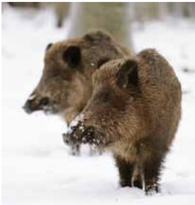
Langhaarige Wilde: Die längsten Schweineborsten kommen vom Wildschwein

B io Produkte sind längst jedem bekannt und auch fast in jedem Haushalt aufzufinden. In Zeiten des Umdenkens, der täglichen Diskussionen über das Kyoto-Protokoll, Fernsehsendungen, Filmen und Büchern mit dem Thema „Leben ohne Plastik“, finden auch immer mehr Kunden den Weg zum Bürstenhaus Redecker. Denn bei uns finden Sie ausschließlich Artikel für die Arbeit und das Leben in einem Haushalt ohne Plastik.