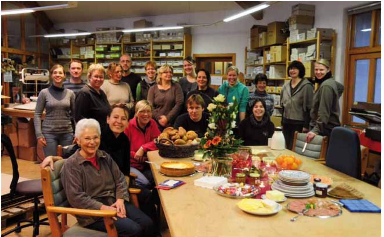
Geburtsfrühstück am Packtisch mit Gratulanten aus dem ganzen Unternehmen