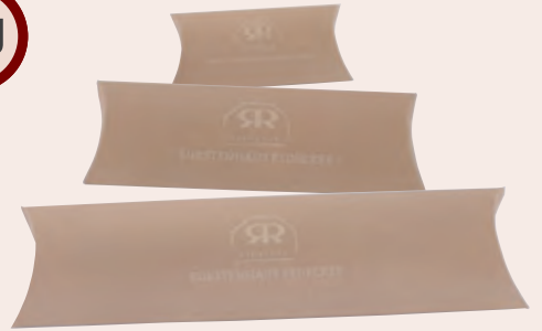
802214, 803013, 804615 Geschenkverpackung