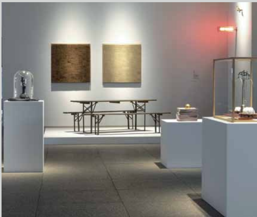
©Rolf Sachs Studio - typisch deutsch? Ausstellung im MAKK, Köln