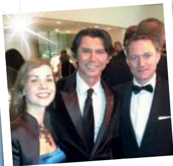
Lou Diamond Phillips

Ihre Redeckers quergebuerstet@redecker.de