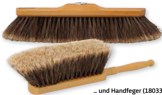
... und Handfeger (180330) mit geschlitztem Rosshaar.

chene Qualität sind im Übrigen unsere neuen Produkte mit geschlitztem Rosshaar – doch, das gibt es. In einem mechanischen Verfahren werden die Haare an beiden Enden geschlitzt – sie werden deutlich flexibler und weicher und können so perfekt gegen feinen und feinsten Staub eingesetzt werden. →