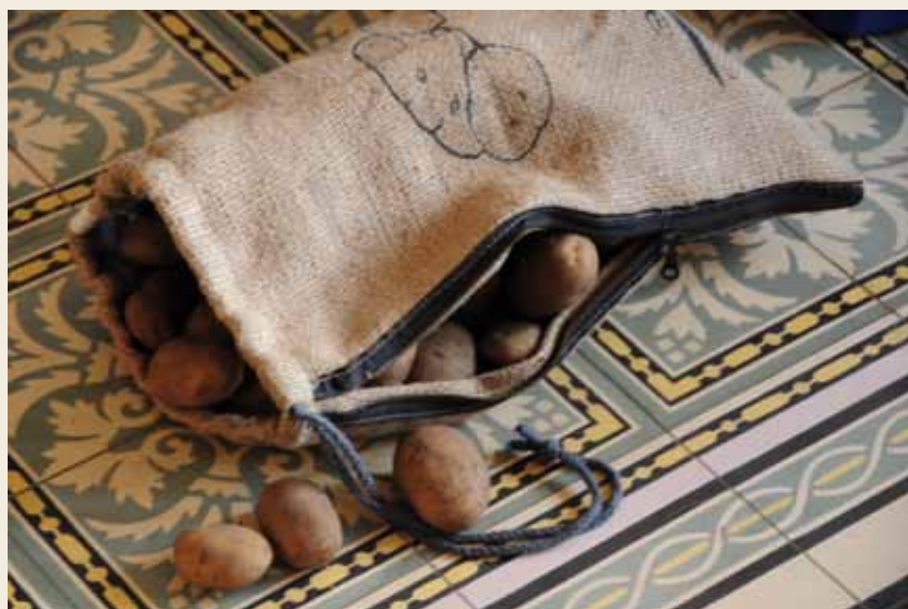
NOUVEAU: Sac pour garder les pommes de terre (302609)

Nous vous souhaitons un bon appétit, en utilisant notre set à pomme de terre.