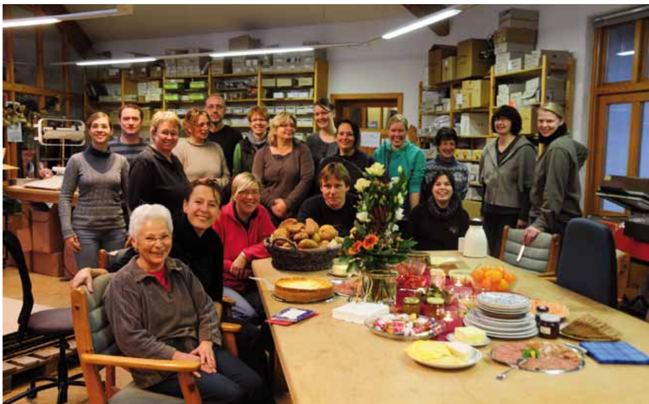
Petit-déjeuner sur la table d'emballage avec notre personnel.