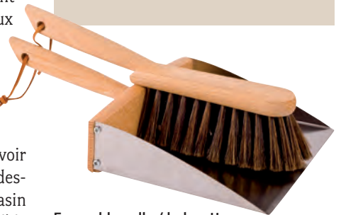
Ensemble pelle / balayette avec attache magnétique (110022): ce qui va ensemble reste ensemble.

Votre équipe Redeckers quergebuerstet@redecke.de