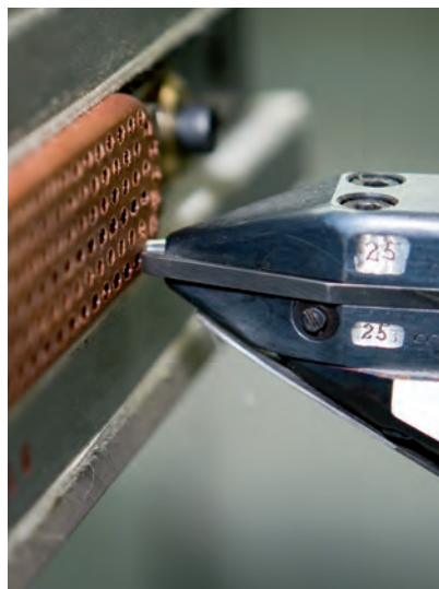
Ci dessus: Le poinçon sur corps de brosse - le pinceau de poils est déjà à l'intérieur.

La machine tourne à présent à pleine capacité. Autour d'elle, les employés de l'atelier sont occupés à la poursuite des tâches manuelles les plus complexes: ils découpent à la scie à ruban, appliquent de l'huile de lin, mettent en forme et poinçonnent le cuir, inspectent et découpent. Les machines sont utilisées tout au long du processus de fabrication en complément des opérations manuelles. La qualité d'une brosse fabriquée main ne peut être égalee par une machine. C'est évident pour tout le monde ici. Le produit est fabriqué par des personnes et c'est une chose à laquelle nous sommes très attachés.