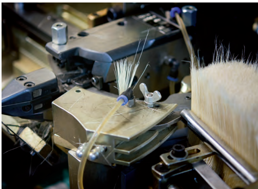
A gauche: La pointe du poinçon, qui est alimenté avec un pinceau de poils provenant du réservoir de droite. Au milieu, un pinceau de poils sur le chemin de l'emporte-pièce.