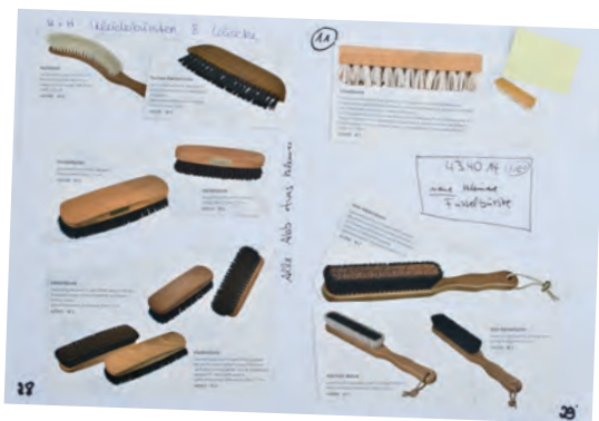
Le copié collé du prototype de catalogue. Le commencement de tout.

La présentation d'un article sur une page est toujours testée en utilisant une démarche "couper-coller": feuilles de papier au format A3 pour le fond, images de produits coupés de l'ancien catalogue pour le contenu. Mais d'où viennent les photos? Une seconde source est utilisée: les photographies de studio retouchées. Ensuite a lieu le rendez-vous annuel avec le photographe dans nos locaux: la