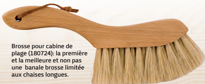
Brosse pour cabine de plage (180724): la première et la meilleure et non pas une banale brosse limitée aux chaises longues.

production, dans une certaine mesure de manière presque trop parfaite ... ce qui est peut-être typique de l'esprit allemand.