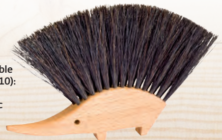
Balayette de table Hérisson (421110): "Forms follows function" - avec une pointe d'humour.