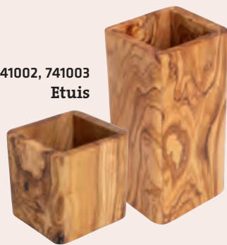
741002, 741003 Etuis