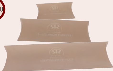
802214, 803013, 804615 Emballage cadeau