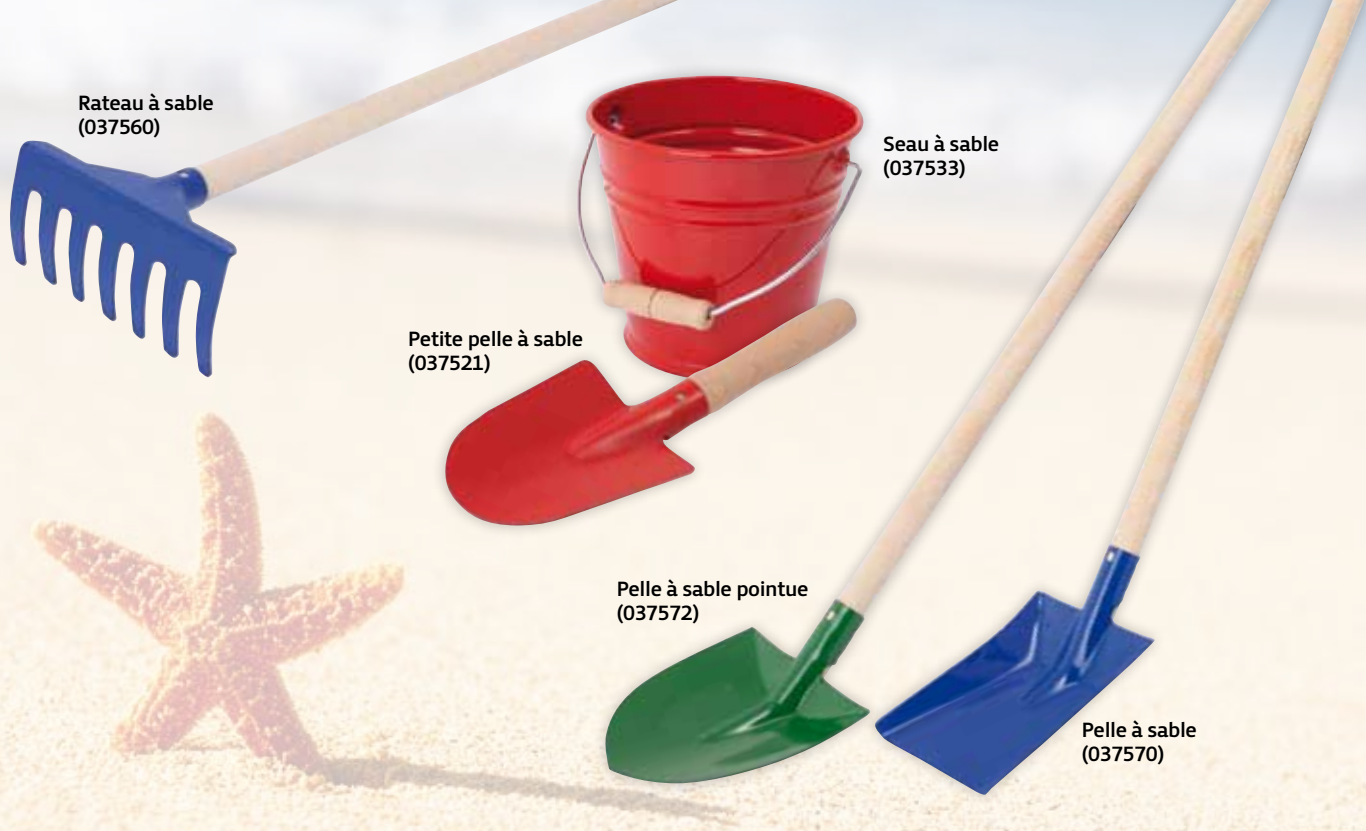
Rateau à sable (037560)