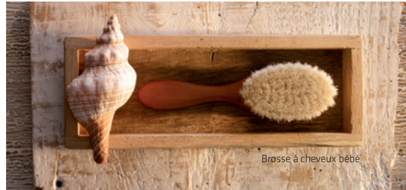
Brosse à cheveux bébé

Les poils de chèvre sont particulièrement doux et respectueux du délicat cuir chevelu de bébé. Pour les petits enfants, nous recommandons des brosses à cheveux avec de douces soies de porc - car les «brosses pour adulte» sont généralement encore trop dures pour la peau délicate de bébé.