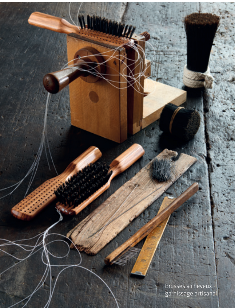
Brosses à cheveux - garnissage artisanal